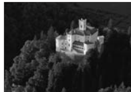
ZRAČNI SNIMAK DVORCA POČETKOM 21. STOLJEĆA

Taj broj posjetitelja, prema procjenama, može osigurati prihod od četiri milijuna kuna godišnje, što bi trebalo biti dostatno za pokriće svih troškova – od hladnoga pogona ustanove do minimalnoga investicijskog održavanja. Sadašnji troškovi „hladnoga pogona” iznose 2.700.000 kuna godišnje.