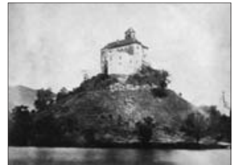
DVORAC PRIJE OBNOVE POLOVICOM 19. ST.