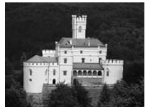
DVORAC TRAKOŠĆAN DANAS