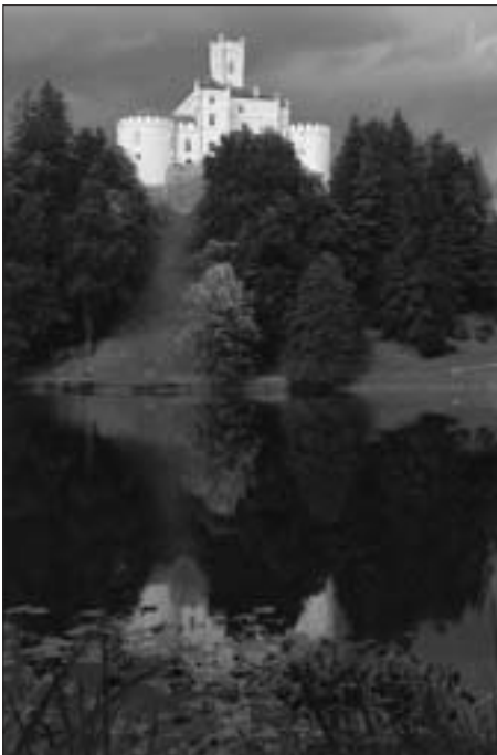
POGLED NA DVORAC S JEZERA