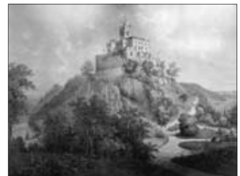
DVORAC NAKON OBNOVE U 19. ST.